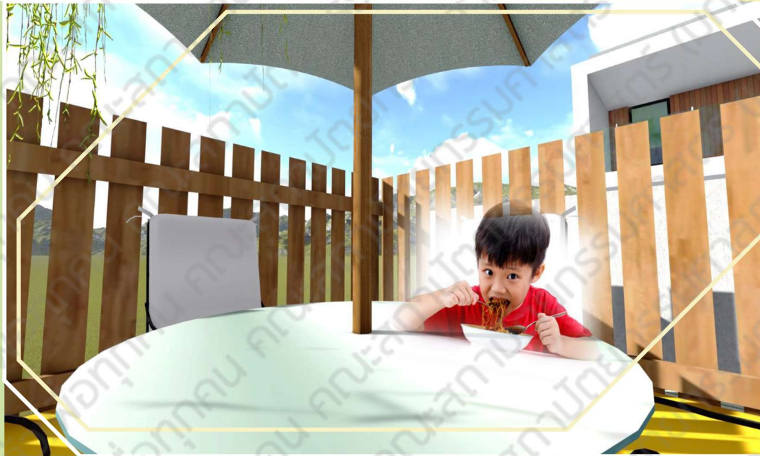
กินข้าวเช้า