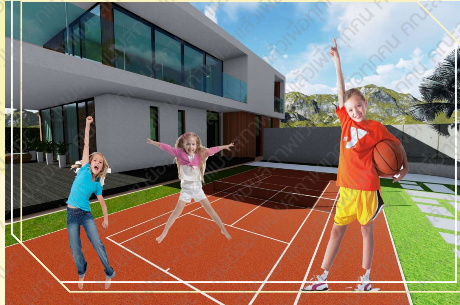
พื้นที่ออกกำลังกายกลางแจ้ง